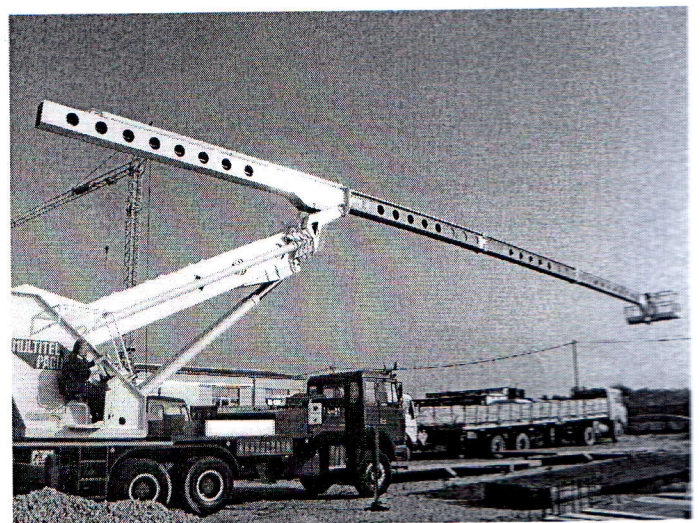
Slika 1a i 1b. Hidraulična polužna kamionska dizalica sa platformom